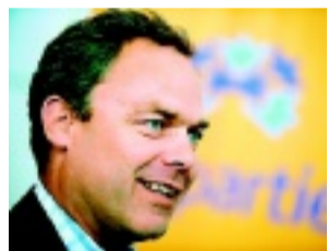
Jan Björklund.